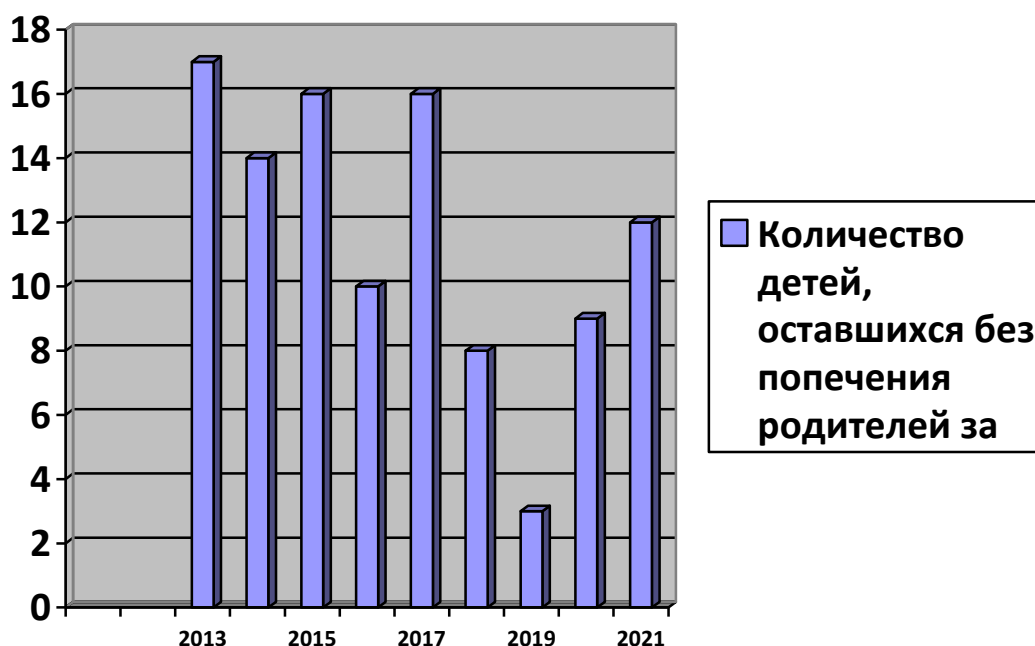
Общая численность детей, оставшихся без попечения родителей, учтенных на конец года

Главной функцией органов опеки и попечительства является выявление и устройство детей-сирот и детей, оставшихся без попечения родителей.