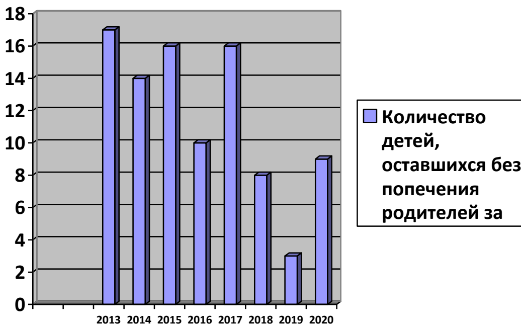
Общая численность детей, оставшихся без попечения родителей, учтенных на конец года

Главной функцией органов опеки и попечительства является выявление и устройство детей-сирот и детей, оставшихся без попечения родителей.